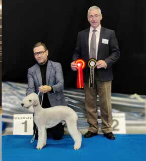
Jyväskylä NORD, Kimalteisen And Proud Of It ROP