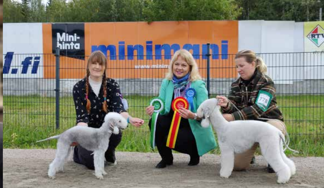
Jyväskylä RN, Legally A Ladys Love ROP Oikeesti Nuori Kapinallinen VSP, kuvaaja: Minna Koskenmäki