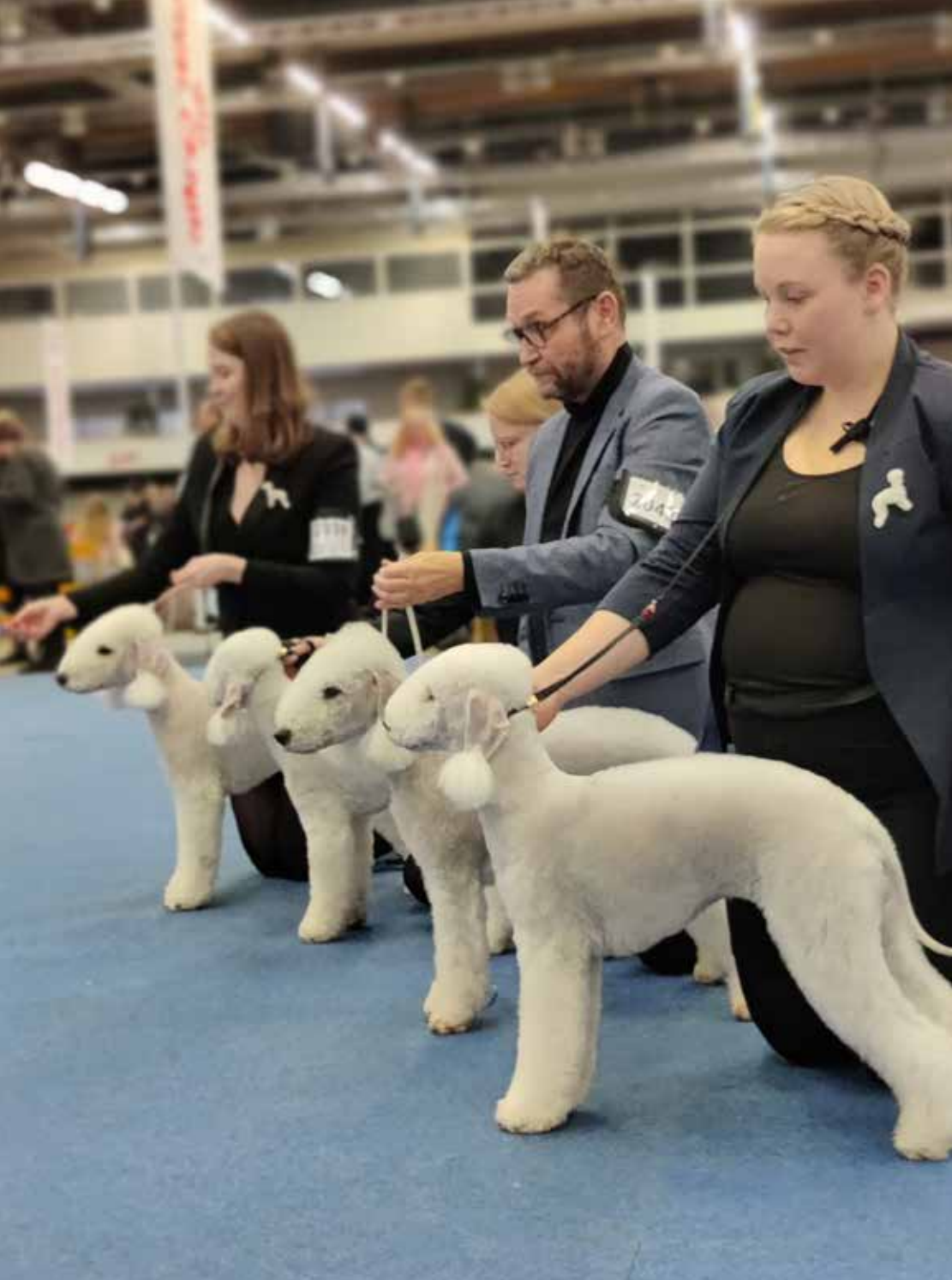
Pohjoismaiden Voittaja, Kimalteisen ROP-kasvattaja, kuvaaja: Leena Kurki-Salomaa