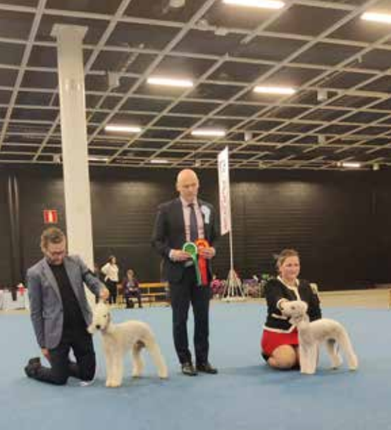
Voittaja 2022, Notice Bahama Mama ROP, Kimalteisen And Proud Of It VSP, kuvaaja: Leena Kurki-Salomaa