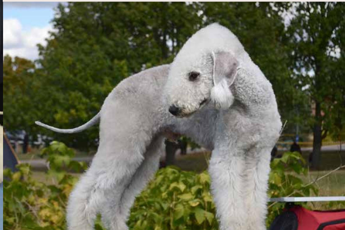
Lahti RN, Tinwelindon Apollon