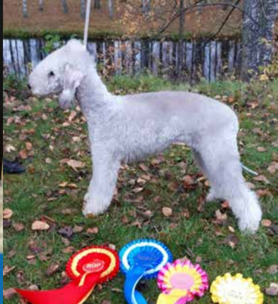
Lahden pentunäyttely, Meripihkan Running Up That Hill