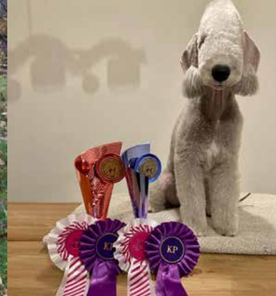
Helsinki ja Voittaja Puppy Show, Precious Blue Counting Stars